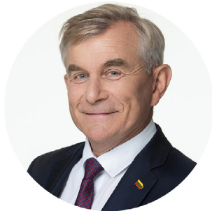
Viktoras Pranckietis LR Seimo narys