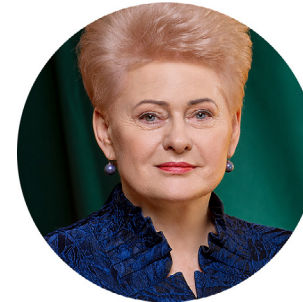
Dalia Grybauskaitė LR Prezidentė