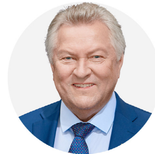
Kazys Starkevičius LR Seimo narys