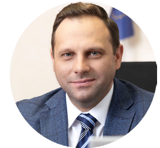
Dr. Ignas Hofmanas LR Žemės ūkio ministras